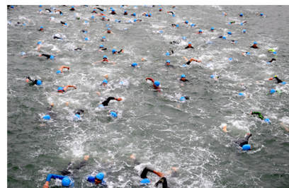
Une course à Saintes

Une exposition publique de ces photos s'est déroulée à la mairie du 8 juillet au 30 août, et s'est achevée, là aussi, autour d'un verre de l'amitié. En voici quatre ci-dessous ; d'autres photos illustrent la quatrième de couverture de ce bulletin.