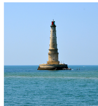
Le phare de Cordouan

Jeux d'eau : un clin d'oeil à une scène de film par une descendante de lavandière, de la Dolce Vita au Loubat, où il fait bon vivre.