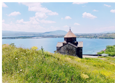
Un paysage d'Arménie, le lac Sevrans