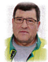
Fabrice Rousselot Bâtiments Peinture/Entretien

Fabrice était en convalescence au moment de la prise des photos. Toutes nos pensées vont vers lui pour lui souhaiter un bon rétablissement